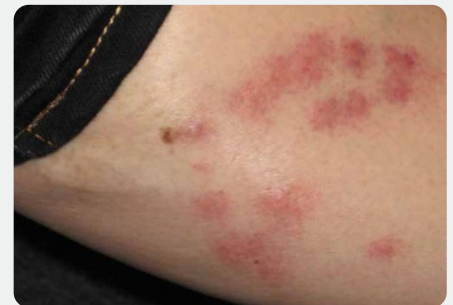
Bett från vägglöss