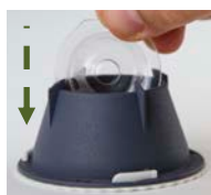
Sätt i doftbetet