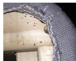
Spår efter vägglöss

Om du hittar vägglöss vid inspektion eller i fällorna kontakta omgående ditt försäkringsbolag och ett professionellt saneringsföretag.